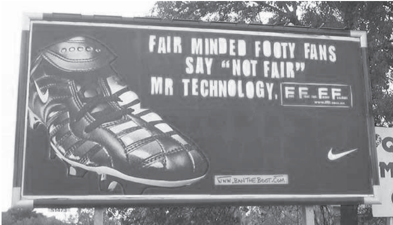
Nike: Air Zoom-Kampagne, 2001.

eigens dafür eingerichteten Website dagegen protestierte, dass die technische Überlegenheit des Sportschuhs gegen sportliche Fairness verstoße (vgl. Antimedia 2006; Borries 2004: 60f.).