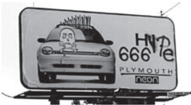
Chrysler: Manipuliertes Plymouth Neon Billboard, 1994.

1994 benutzte eine Kampagne von Chrysler zur Markteinführung des Plymouth Neon , der laut Agentur an eine Zielgruppe zwischen 18 und 34 gerichtet war, eine BLF-Taktik (vgl. Clear Channel Outdoor 2006): Zunächst war auf den Plakatwänden nur das Fahrzeug auf einem weißen Grund zu sehen, daneben das Wort »Hi«. Um es mit den verkaufsfördernden Attributen des Unkonventionellen, Nonkonformistischen aufzuladen, wurden auf dem Plakat von der Werbeagentur in regelmäßigen Abständen Ps oder ein C und zwei Ls hinzugefügt, so dass sich die Worte »Hip« oder »Chill« 1 ergaben; des weiteren wurde es mit gesprühten Pfeilen verändert oder dem Wagen gar ein Irokesenschnitt verpasst (vgl. Abb. 1).