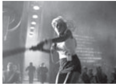
Apple Spot 1984, 2004

Diese radikale Hipness haben mittlerweile auch die Designer von Videospiele aufgegriffen und brachten 2001 State Of Emergency (SOE) auf den Markt. Darin kann man den Ausnahmezustand während der Proteste bei der Welthandelskonferenz 1999 in Seattle im heimischen Wohnzimmer nachspielen: Zunächst schließt man sich einem »Freedom Movement« an und kämpft als local hero gegen »The Corporation« 2 , einer finanziell und politisch machtvollen Institution, die »Capital City« beherrscht und ihre Einwohner unterdrückt. Der Trailer zum Spiel ist im Stil einer Wochenschau gestaltet; zunächst ist das Voice-Over des Nachrichtensprechers zu hören: »Welcome to Capital City, a perfect example of happy and stabilized modern living, thanks to the thoughtful and benevolent leadership of The