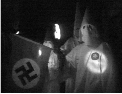
Abb. 1: Born-Beitrag über die deutsche Abordnung des Ku-Klux-Klans